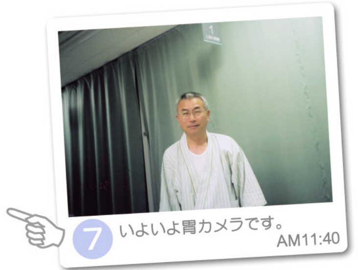
7 いよいよ胃カメラです。AM11:40