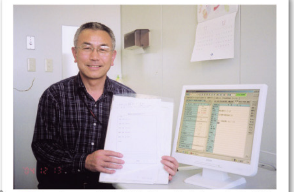
9 全ての健診が終わり、ドクターから健診結果の説明を受けてひと安心です。PM2:00